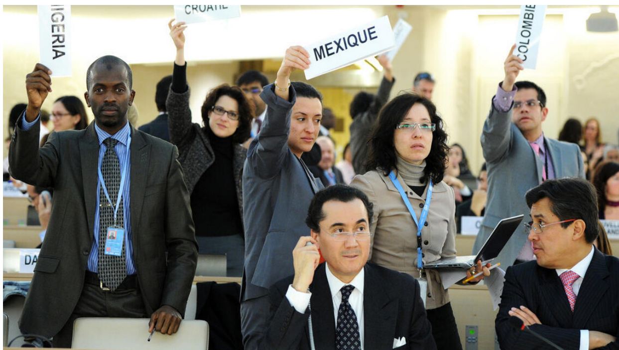
Des délégués demandent la parole lors du groupe de discussion du Conseil des droits de l'homme sur les lois et pratiques discriminatoires ou les actes de violence à l'encontre des individus en raison de leur orientation sexuelle et de leur identité de genre. 7 mars 2012.