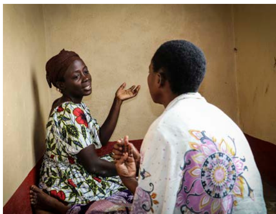
Province du Sud-Kivu, Sange. Une assistante psychosociale (vue de face) et une victime de violences sexuelles lors d'une séance de conseil dans le centre d'accueil pour femmes de la ville. Le CICR soutient une douzaine de centres d'accueil pour femmes dans les deux Kivus, où les victimes de violences sont prises en charge. 9 février 2021.