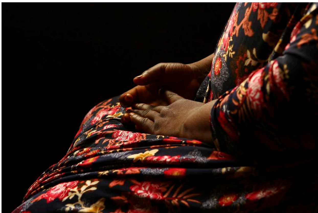
Préfecture Nana-Grébizi, hôpital Kaga-Bandoro. Cette femme a été victime de violences sexuelles. Le Comité international de la Croix-Rouge (CICR) lui apporte un soutien psychosocial et l'aide à trouver des moyens de subsistance durables. 28 octobre 2022.