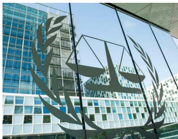
Vue de la CPI, à La Haye, Pays-Bas. Lors de l'ouverture des locaux permanents, l'ancien secrétaire général Ban Ki-moon a qualifié l'inauguration de tournant dans les efforts mondiaux pour promouvoir et faire respecter les droits de l'homme et l'État de droit. 19 avril 2016.

À mesure que l'on aborde les environnements dans lesquels les opérations de paix des Nations Unies se déroulent, il est important d'examiner comment la dynamique du pouvoir peut compliquer le consentement. Par exemple, donner son consentement à des personnes armées est particulièrement complexe en raison du déséquilibre extrême et immédiat.