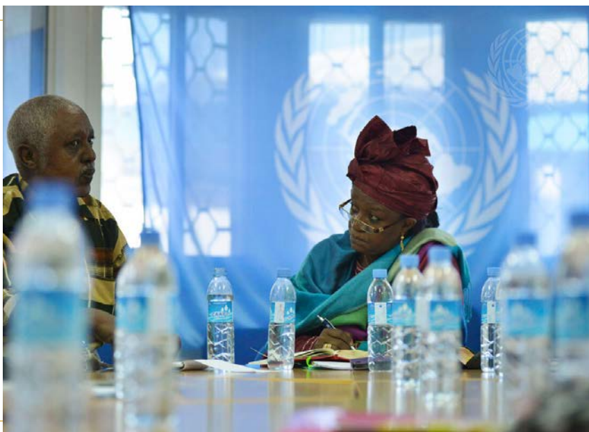
Zainab Bangura (à droite), Bureau de la Représentante spéciale du Secrétaire général chargée de la question des violences sexuelles commises en période de conflit, rencontre des membres du Comité consultatif de la police à Mogadiscio, en Somalie. Mme Bangura s'est rendue en Somalie dans le cadre d'une mission visant à dialoguer avec des fonctionnaires des Nations Unies, des partenaires de la société civile et diverses parties prenantes sur les moyens de lutter contre les violences sexuelles liées aux conflits et de les prévenir. 2 avril 2013.

s'intensifie après un conflit et peut augmenter avant 11 . Bien que la violence familiale soit rarement liée aux violences sexuelles liées aux conflits dans l'élaboration des politiques, les inégalités préexistantes entre les hommes et les femmes dans la société (telles que celles contribuant à la violence familiale) sont exacerbées pendant les conflits et contribuent aux violences sexuelles et liées aux conflits 12 .