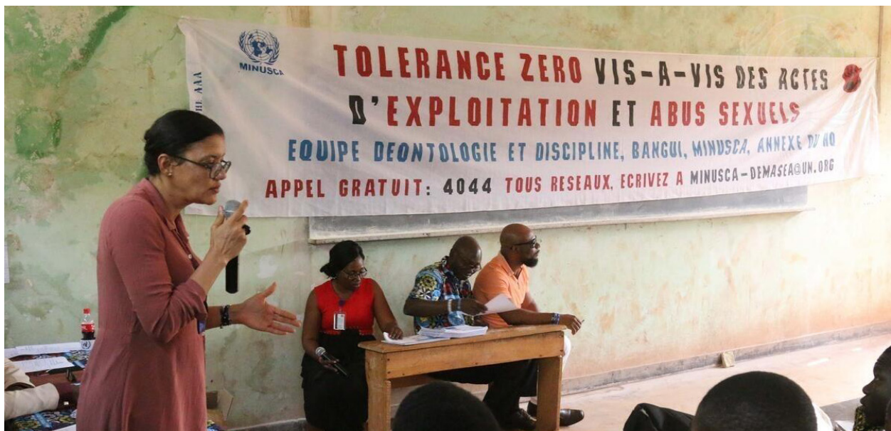
Des membres du personnel de MINUSCA ont organisé une manifestation pour la sensibilisation des élèves sur l'exploitation et abus sexuel à Bangui. 24 janvier 2018.

Plus important encore, les auteurs souhaitent rendre hommage aux innombrables personnes qui se considèrent comme des survivants des violences sexuelles et fondées sur le genre. Nous espérons que la diffusion d'informations à ce sujet soutiendra les efforts de prévention et d'intervention.