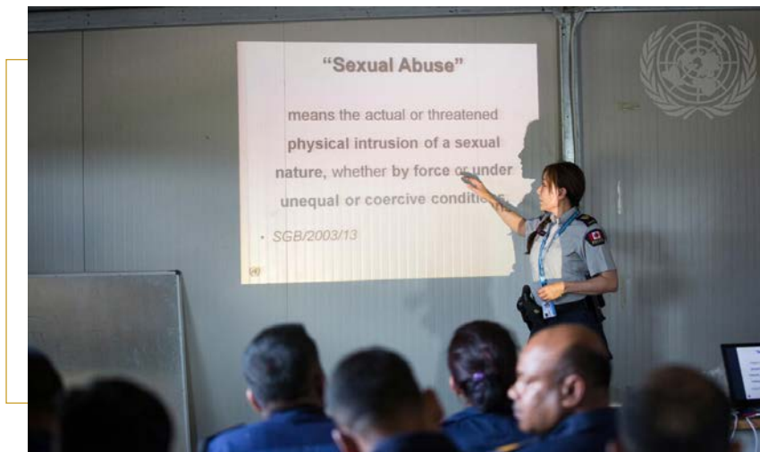
Deborah Porter (Canada), officier de police des Nations Unies, lors d'une session d'information interactive sur la prévention de l'exploitation et des abus sexuels avec l'unité de police constituée du Népal en service auprès de la Mission des Nations Unies pour l'appui à la justice en Haïti (MINUJUSTH). 25 avril 2018.

On entend par abus sexuel toute atteinte sexuelle commise avec force, contrainte ou à la faveur d'un rapport inégal, la menace d'une telle atteinte constituant aussi l'abus sexuel 34 .