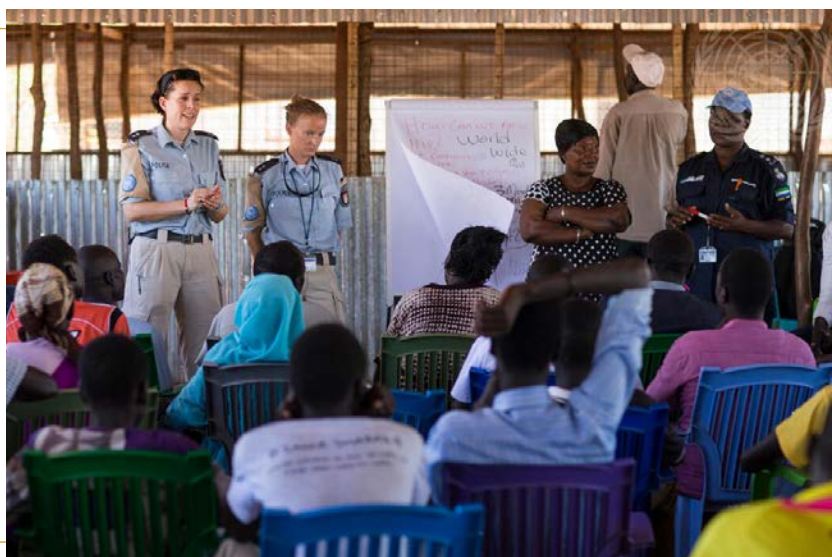
La Mission des Nations Unies au Soudan du Sud (MINUSS) dispense une formation sur la lutte contre les violences sexuelles et fondées sur le genre aux résidents d'un site de protection des civils (PoC 3) à Juba. La formation est menée par l'équipe de protection des femmes, des enfants et des personnes vulnérables de l'UNPOL, en coordination avec la Division des droits de l'homme et l'Unité de protection de l'enfance de la MINUSS. 12 mai 2016.