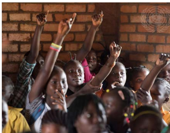
Des enfants d'une école de Bangui participent à un cours sur la violence fondée sur le genre animé par des agents de la police des Nations Unies (UNPOL) servant au sein de la Mission multidimensionnelle intégrée des Nations Unies pour la stabilisation en République centrafricaine (MINUSCA). 23 octobre 2017.

Tout au long de ce cours, il est préférable d'utiliser le terme « violences sexuelles et fondées sur le genre » ; toutefois, lorsque des documents politiques ou des recherches spécifiques sont cités, le cours utilise les termes employés par la source afin d'assurer l'exactitude des informations. Le plus souvent, les politiques et les organisations des Nations Unies utilisent le terme violences sexuelles liées aux conflits. Les chercheurs cités dans ce cours étudient souvent les violences sexuelles liées aux conflits ou le viol en temps de guerre. Là encore, le cours notera la terminologie utilisée par la source, mais sa préférence va au terme violences sexuelles et fondées sur le genre.