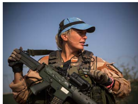
La Suède est l'un des principaux contributeurs de troupes à la MINUSMA, avec un bataillon de 252 militaires, dont 25 femmes. Un soldat de la paix suédois en patrouille à Tombouctou. 11 octobre 2018.

Les dix règles suivantes résument les choses « A faire et à ne pas faire » associées aux trois principes directeurs. Chaque membre d'une mission de maintien de la paix se voit octroyer une carte lui rappelant son code de conduite. Il convient de la lire fréquemment et de ne pas enfreindre le code. Enfreindre le code aura de graves conséquences personnelles pour vous et éventuellement pour la mission