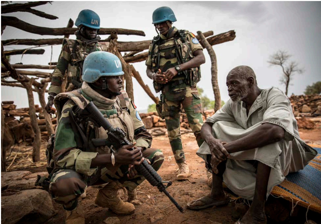
Des soldats de la paix du Sénégal servant dans le cadre de la Mission multidimensionnelle intégrée des Nations Unies pour la stabilisation au Mali (MINUSMA) patrouillent dans les zones sensibles du centre du Mali. Les soldats de la paix parlent avec la population locale pendant la patrouille dans les villages de So (Bandiagara), Sadhia Pheul (Bankass), et Djominati (Bankass), à l'extérieur de Mopti. 4 juillet 2019.