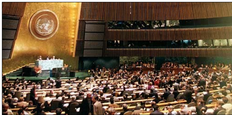
L'assemblée générale se prépare pour une session régulière des États Membres.

Le 10 janvier 1946, la première Assemblée générale, avec les 51 États fondateurs représentés, s'est ouverte à Central Hall, Westminster, Londres et a adopté sa première résolution le 24 janvier 1946. Son premier thème de discussion était l'emploi pacifique de l'énergie atomique et l'élimination des armes atomiques et de destruction massive.