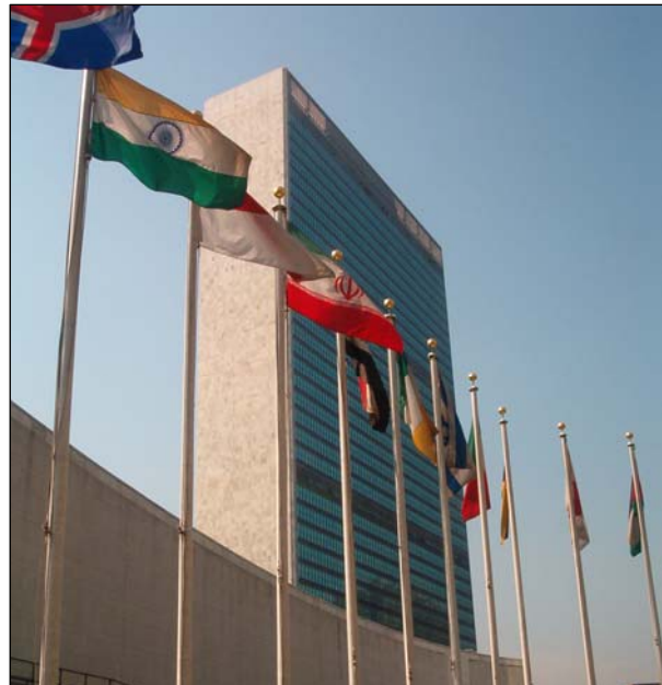
Le siège des Nations Unies à New York, New York.

Le nom de « Nations Unies », imaginé par le Président des États-Unis d'Amérique Franklin D. Roosevelt, fut utilisé pour la première fois durant la Seconde Guerre mondiale au sein de la « Déclaration des Nations Unies », le 1 er janvier 1942, quand les représentants de 26 nations engagèrent leurs gouvernements dans une poursuite commune de la guerre contre les puissances de l'Axe.