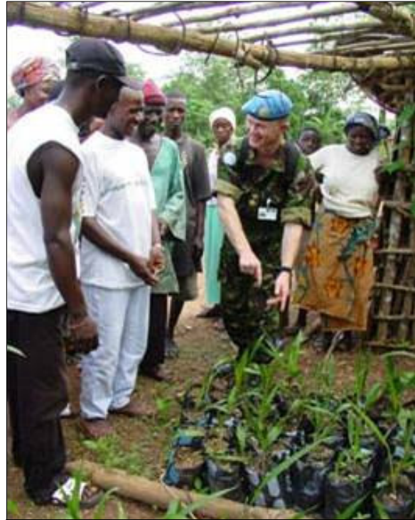
Los pacificadores deben mostrar siempre respeto e imparcialidad a la población local.

En la siguiente parte de esta sección, se explica cada principio, además de estar acompañado por los que “Debe o No Debe Hacerse”, relevantes para guiar a los pacificadores. Algunas de estas directrices se aplicaran a menudo a mas de uno de estos principios.