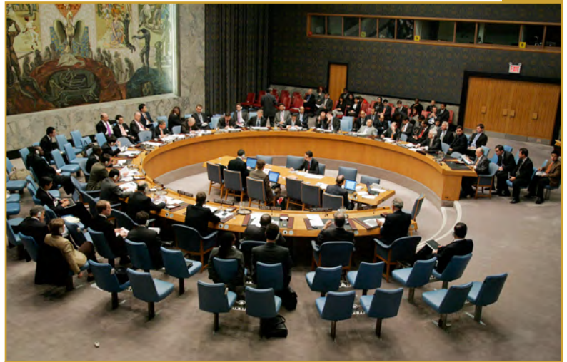
Reunión del Consejo de Seguridad para abordar el mantenimiento de la paz y la seguridad internacionales, así como el fortalecimiento de la seguridad colectiva mediante su regulación general y la reducción de las armas.