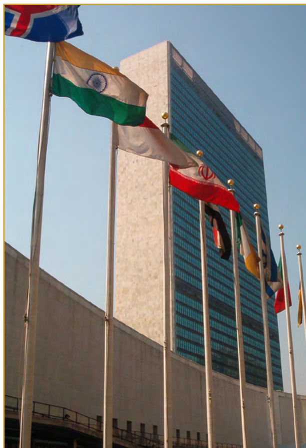
Sede de las Naciones Unidas en la ciudad de Nueva York.

Aunque la Carta de las Naciones Unidas no