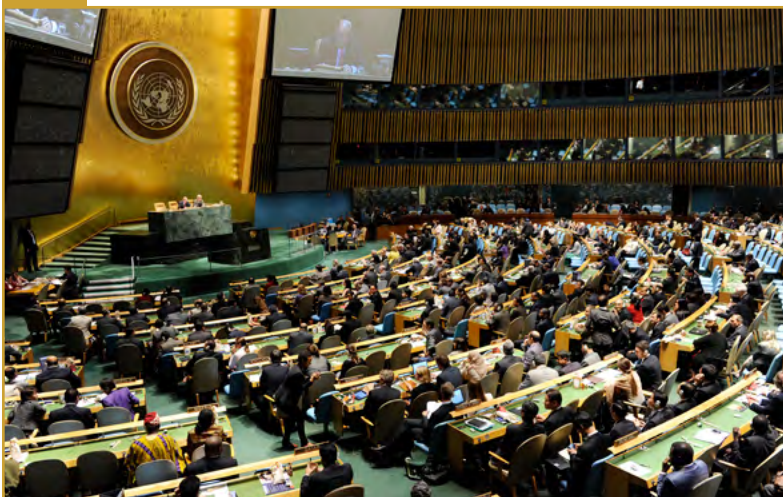
Amplia vista del salón de la Asamblea General durante una reunión en la que se eligieron a cinco Estados —Colombia, Alemania, la India, Portugal y Sudáfrica— como miembros no permanentes del Consejo de Seguridad por periodos de dos años a partir de 2011.

La Asamblea General opera en periodos de sesiones, principalmente un periodo ordinario de sesiones al año, que suele comenzar en el mes de septiembre y que se prolonga hasta el mes de diciembre. Al comienzo de cada periodo ordinario de sesiones, la Asamblea General elige a un nuevo presidente, a 21 vicepresidentes, así como a las personas que presidirán cada una de las seis Comisiones principales de la Asamblea. A fin de garantizar una representación geográfica equitativa, la presidencia de la Asamblea rota cada año entre cinco grupos de Estados: África, Asia,