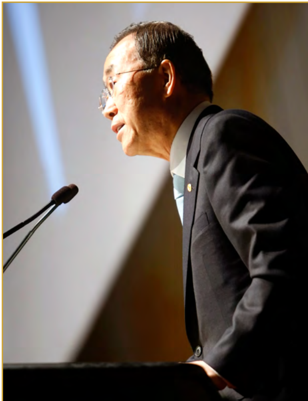
El Secretario General Ban Ki-moon se dirige a la Tercera Conferencia Mundial sobre el Clima (CMC-3) en Ginebra.

El Consejo de Seguridad está organizado de tal manera que le permite llevar a cabo sus tareas de forma permanente y mantener informados al Secretario General y a la Asamblea General de sus actividades.