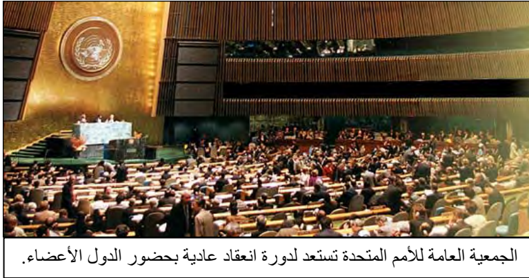
الجمعية العامة للأمم المتحدة تستعد لدورة انعقاد عادية بحضور الدول الأعضاء.

الجمعية العامة هي الجهاز التشاوري الرئيسي للأمم المتحدة. انها تتشكل من ممثلين لجميع الدول الاعضاء ، و لكل منهم صوت واحد. القرارات التي تخص المسائل الهامة ، مثل السلام و الامن ، قبول اعضاء جدد ، و الميزانية ، تتطلب اكثرية ثلثي الاصوات. بينما تكفي الاكثرية البسيطة عند التصويت على باقي المسائل.