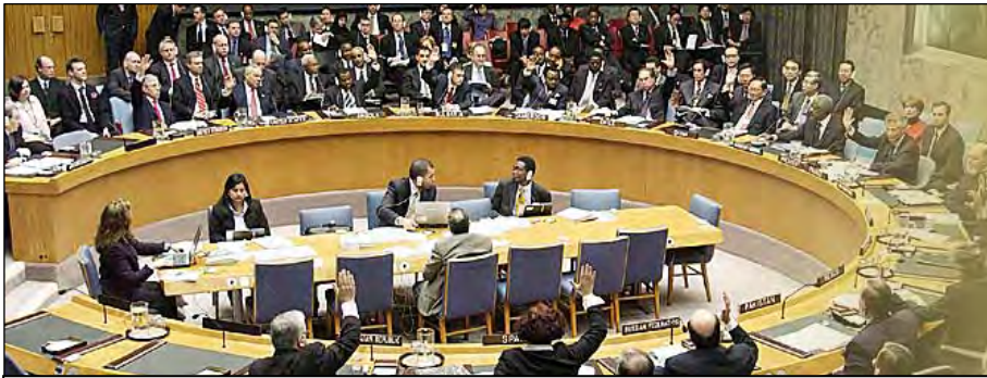
أعضاء مجلس الأمن يصوتون على احد قراراته برفع الأيدي.

المسؤولية الرئيسية لمجلس الامن هي الحفاظ على السلام و الامن الدوليين. يتركب مجلس الامن من خمس اعضاء دائمين ، الصين و فرنسا و روسيا و المملكة المتحدة والولايات المتحدة ، و عشر اعضاء غير دائمين يتم انتخابهم لتمثيل