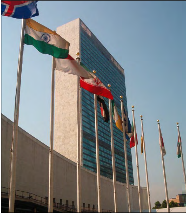
مقر الأمم المتحدة في نيويورك، الولايات المتحدة الأمريكية.

بدأت الأمم المتحدة بخمسين دولة في 1945 وكانت تلك هي "الدول المؤسسة" ، في 2004 شملت الأمم المتحدة 191 دولة ، بحيث ان جميع دول العالم المعترف بها - تقريباً - هي "عضو عامل" في الأمم المتحدة. هناك ايضاً 17 دولة ومنظمة ليست أعضاء ولكن لها صفة "مراقب" في المقر العام للأمم المتحدة بنيويورك.