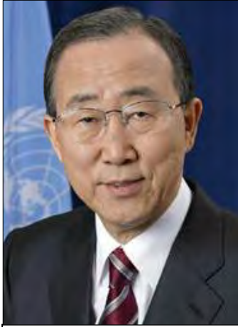
الامين العام بان كي مون، 2007.

بالإضافة الى دورها الإداري ، فإن الامانة العامة مسؤولة عن تسجيل واصدار الاتفاقيات الدولية بعد توقيعها من الدول الاعضاء. مديرها هو الامين العام وهو " اعلى مسئول في المنظمة" ، ويتم تعيينه كل خمس سنوات من قِبَل الجمعية العامة للأمم المتحدة بناء على توصية مجلس الامن. يلعب الامين العام دوراً سياسياً هاماً بالإضافة الى وظيفته في الأمم المتحدة. قد يتم تفويضه من قِبَل وكالات الأمم المتحدة لأداء مهام معينة ، وخصوصاً الوساطة الدولية.